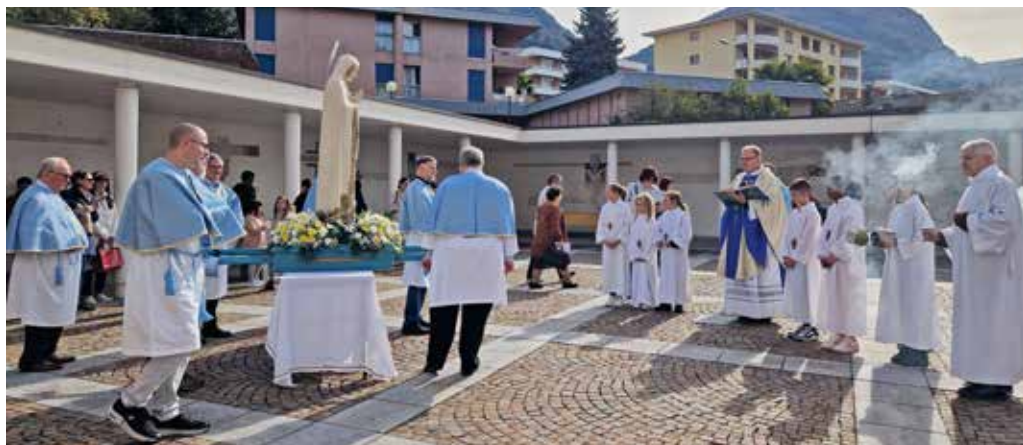
La Santa Messa in San Massimiliano e la processione fino alla chiesina di Fatima