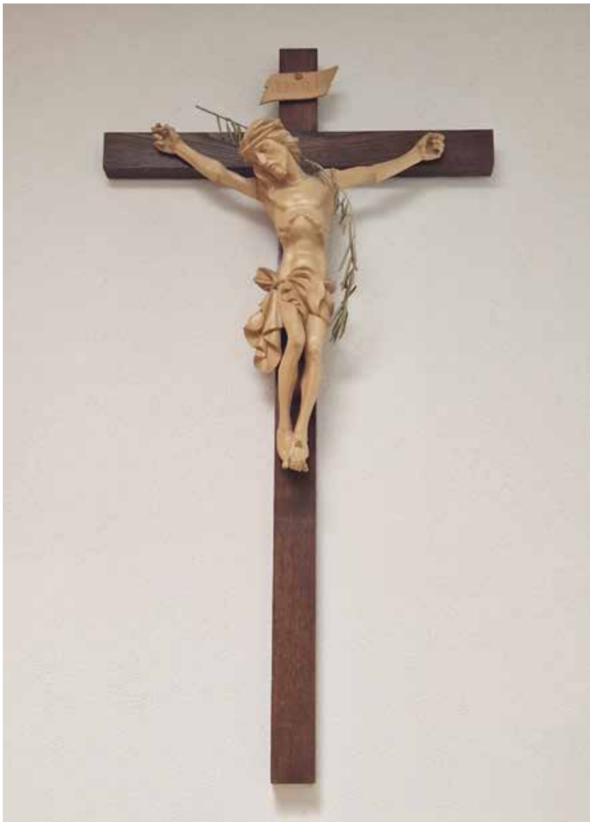
La Croce della Sacrestia di San Massimiliano

Novembre 2024 - Aprile 2025 / Anno 113 - N. 2