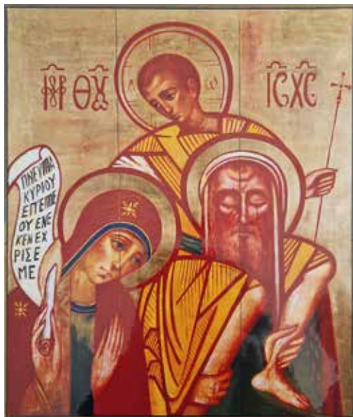
La famiglia di Nazaret

Nella nostra zona/rete pastorale nei prossimi mesi inizierà un cammino di preparazione al matrimonio, contattate al più presto il parroco per maggiori informazioni!